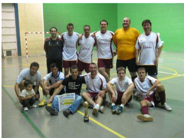
Campeones: La Cuadrilla