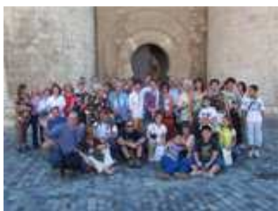
13 DE JUNIO (Hermanamiento)