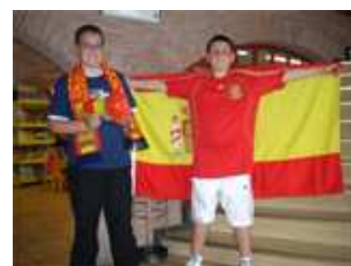
26 DE JUNIO (Todos con España)