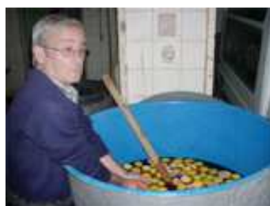
18 DE JUNIO (El zurracapote para las fiestas)