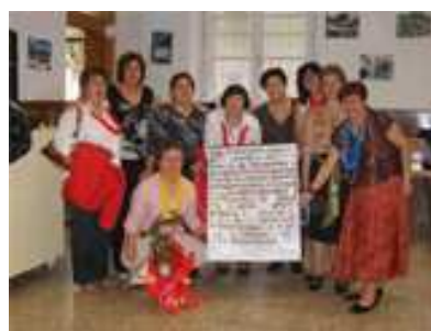
11 DE JUNIO (Asociación de Amas de Casa)