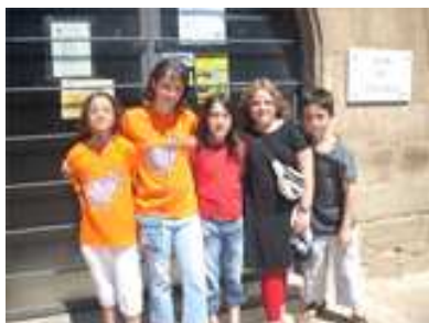
22 DE JUNIO (Preparados para la fiesta)