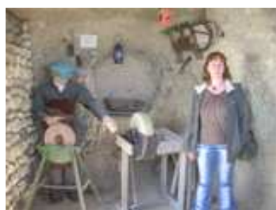
16 DE JUNIO (Margarita en las cuevas trogloditas)