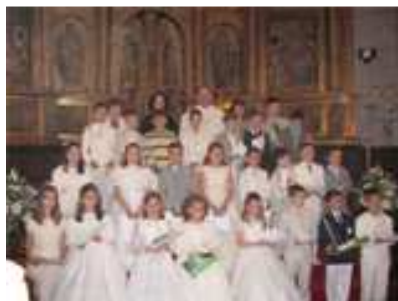
9 DE JUNIO (Primeras Comuniones)