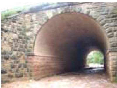
2 DE JUNIO (Crecidas en los ríos)