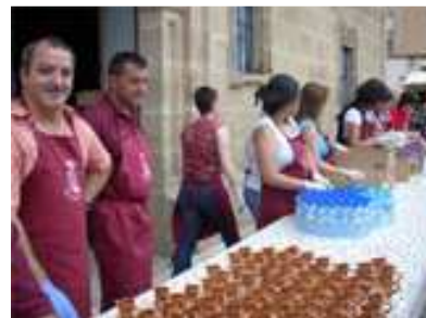
24 DE JUNIO (Degustación en Fiestas)