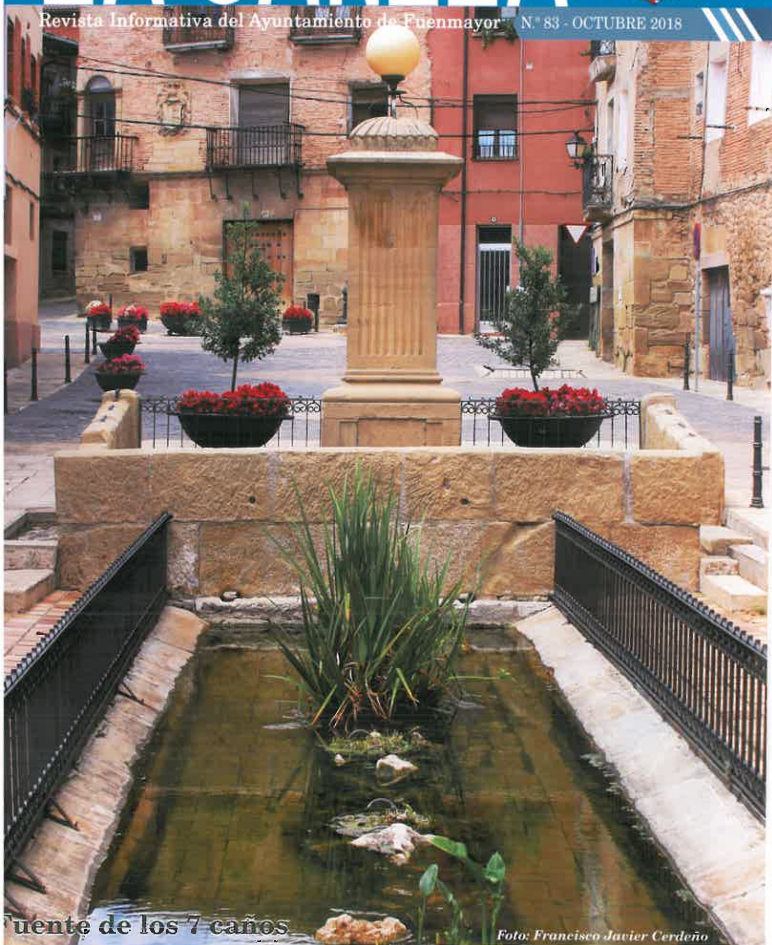
Fuente de los 7 caños

Revista Informativa del Ayuntamiento de Fuenmayor N.º 83 - OCTUBRE 2018