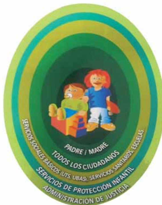
Sistemas de Protección Infantil: Niveles de responsabilidad

El comportamiento del niño en estas ocasiones: Parece reservado, rechazante o con fantasías o conductas infantiles, incluso puede parecer retrasado. Tiene escasas relaciones con sus compañeros. No quiere cambiarse de ropa para hacer gimnasia y no quiere participar en actividades físicas. En ocasiones dice haber sido atacada sexualmente por un padre, cuidador,.. Manifiesta conductas o conocimientos sexuales extraños, sofisticados, inusuales. En numerosas ocasiones presenta dolores abdominales, cefaleas, respiratorios, etc. así como