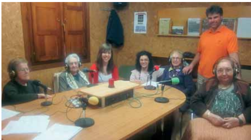
Programa "Mi tercera juventud".

Por otro lado también el Centro de Día Moncalvillo ubicado en nuestra localidad continua con su programa de radio "Mi tercera juventud". Ya es el cuarto que realizan y desde la emisora agradecemos su buen hacer en el desarrollo del programa con sus historias, poesías, debates, chistes y chascarrillos, recetas, etc. Nos lo hacen pasar realmente bien y admiramos su voluntad y siempre buena disposición.