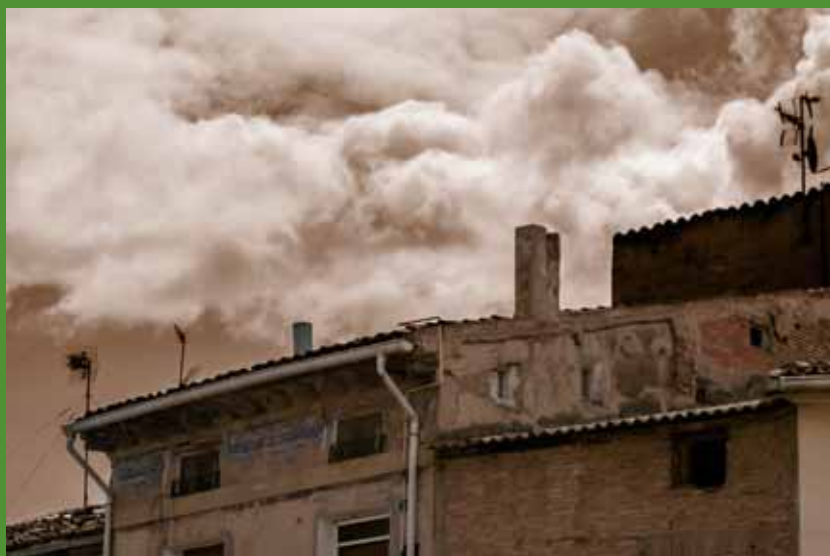
Instantánea ganadora en el Concurso de Fotografía Digital ,“Contraste sepia y retazo de color”, de Ramón Serna.