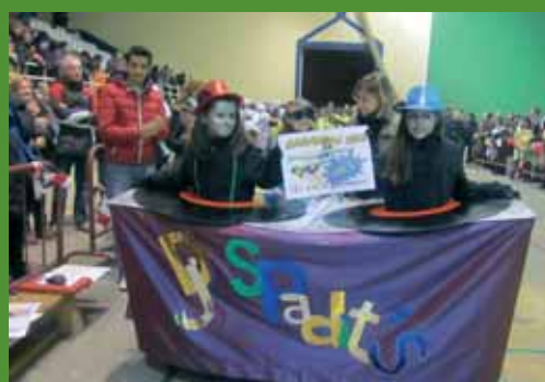
Premio Infantil (100 euros): "D.J. Espadit's".