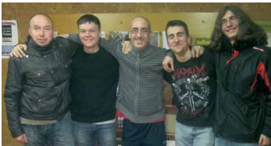
Programa "No le tengas miedo al rock".

Por último ya podemos adelantar que estamos preparando una nueva obra de "radioteatro" que –como la anterior- grabaremos en la emisora municipal y emitiremos próximamente. Y recordar también que los plenos municipales se emiten en la radio los segundos lunes de cada mes a las diez de la noche.