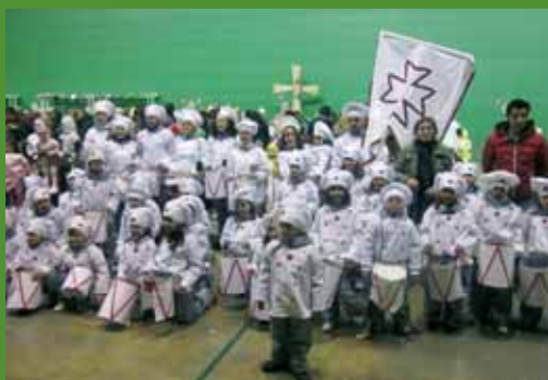
Tercer premio (100 euros): "Fuchútamborrada".