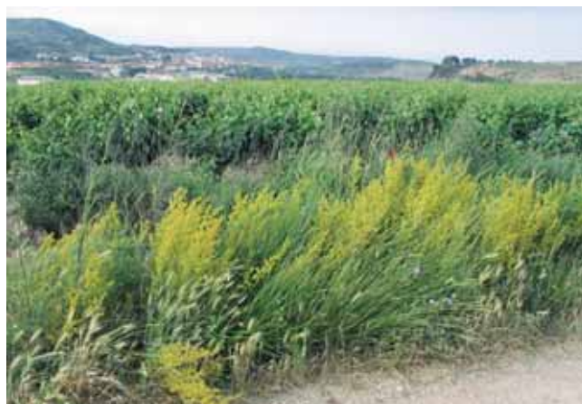
26-06-2008. Los bordes de los caminos se tiñen de amarillo cuando el galio está en plena floración (Camino de Peñagorda, con Lapuebla al fondo).

Comentarios locales. - El galio es otra planta de presencia local, junto con la hierba de San Juan (Hipérico), que tiene relación con nuestro patrono y por ello suele engalanar de amarillo el entorno hacia la celebración de dicha festividad, en los inicios del verano. Suele frecuentar los márgenes de cursos de agua y los bordes de los