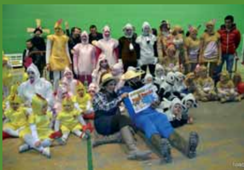
Primer premio (200 euros): "La Granja del 2007".

El mal tiempo obligó a trasladar el desfile al frontón, y a las ocho de la noche, las gradas estaban abarrotadas de público para ver a los diez grupos, todos ellos con disfraces espectaculares y realizados artesanalmente. Tras el desfile y las deliberaciones del jurado, se otorgaron los premios a los cuatro grupos afortunados.