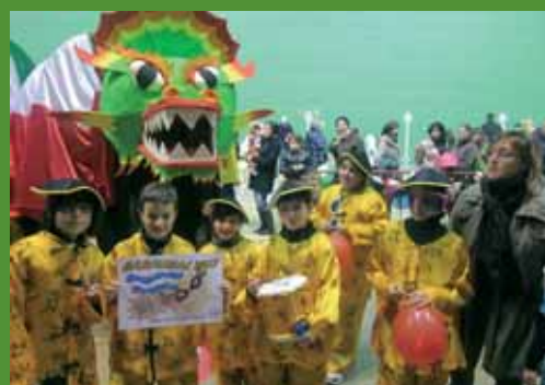
Segundo premio (150 euros): "Año nuevo chino".