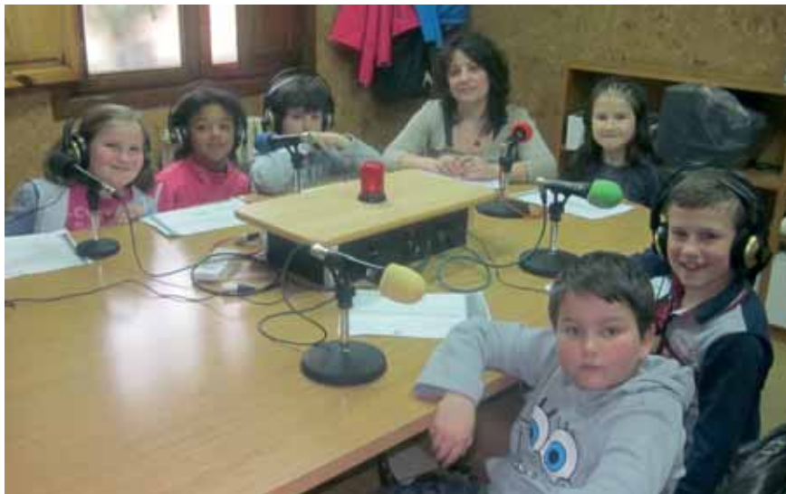
Taller de radio con escolares de Primaria.

Durante estos meses continúa desarrollándose el taller de radio que lleva a cabo la APA del Colegio Cervantes en la radio municipal. Este curso son veinte los grupos de Primaria que han pasado hasta el momento por los estudios de la emisora situados en la Casa de Cultura; cada grupo lee un cuento, recita una poesía o cuenta una historia para después charlar en divertidas tertulias que favorecen su capacidad de expresión y comprensión oral y su habilidad para pensar y reflexionar. El resultado de estos talleres es un programa que se emite los fines de semana a las once de la mañana.