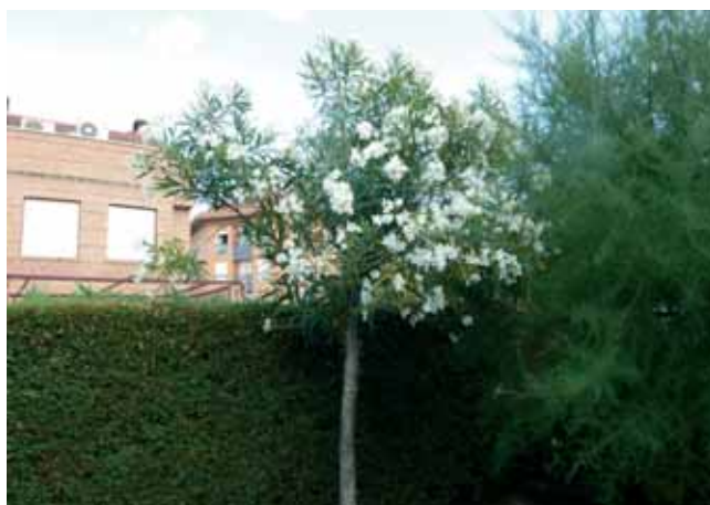
18-08-2011. Con la debida poda, la adelfa puede presentar el aspecto de un árbol de porte pequeño.

Historia.- Nerium , designa su género y proviene de la palabra griega nerion , que a su vez deriva de narós: fluir, manar, en referencia a que el hábitat natural de la adelfa es junto a los cursos de agua. También está asociado a Nereo, dios del Mar. Oleander : epíteto indicativo de que