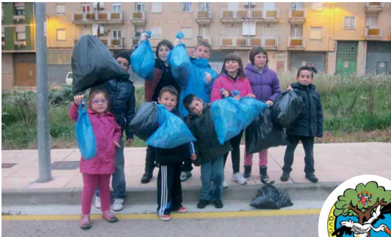
Este pequeño "Gran Grupo" nos dio un ejemplo de responsabilidad y educación recogiendo y reciclando las porquerías tiradas al suelo por personas incívicas.