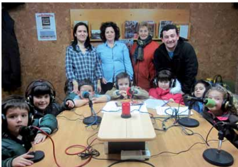
Taller de radio escolar que realiza la APA del colegio Cervantes.