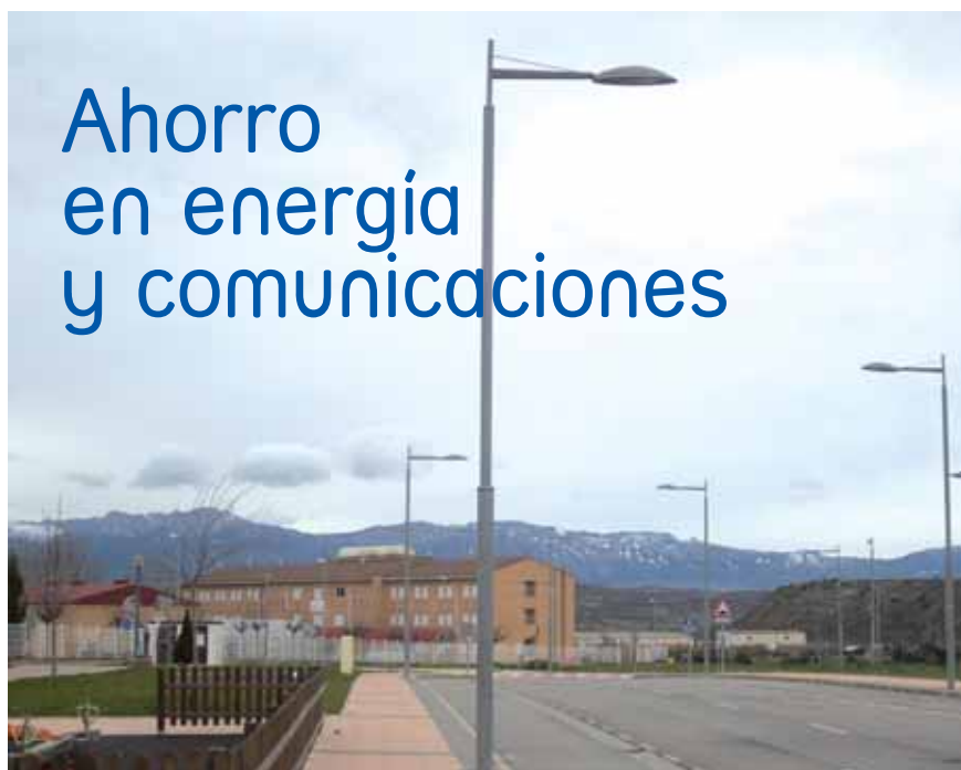
El consumo del alumbrado público se ha reducido de una forma sustancial.

Y otro ahorro importante lo estamos obteniendo en las comunicaciones. El gasto telefónico se ha