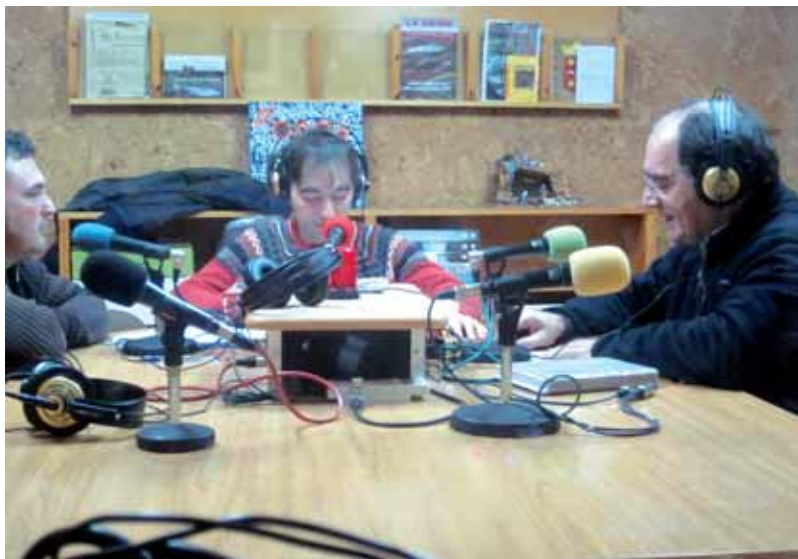
Información local los lunes en el programa de radio ‘Se hace saber’.