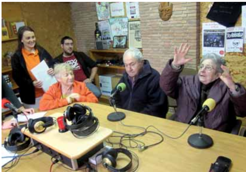
Programa ‘Mi tercera juventud’.