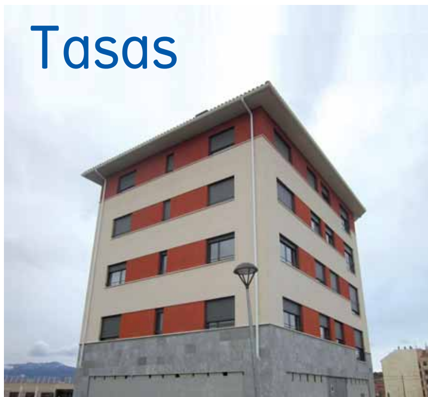
El Ayuntamiento de Fuenmayor no ha subido el IBI.