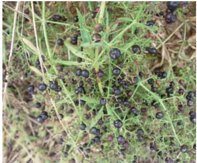
07-08-2009. Detalle de los frutos.

Antiguamente se utilizó también la raíz con fines medicinales para combatir el raquitismo. Los árabes la emplearon para facilitar el parto.