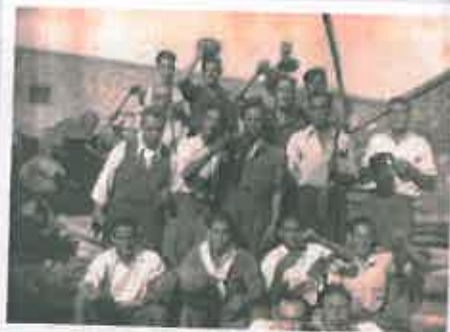
San Juan 1949