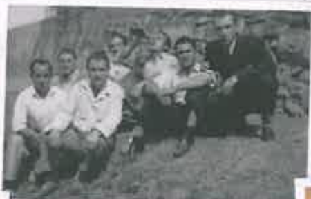
San Juan 1951