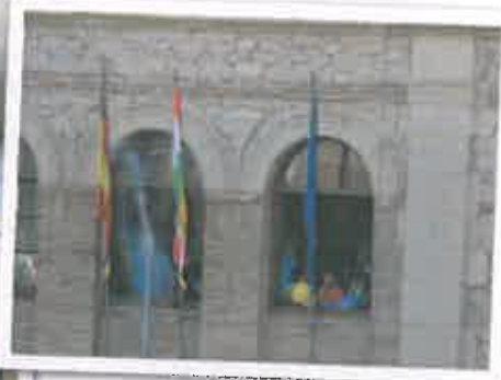
San Juan 2018