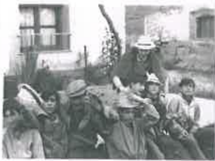
San Juan 1970