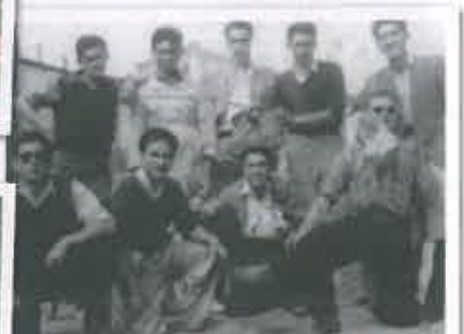
San Juan 1950