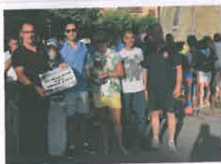
San Juan 2017