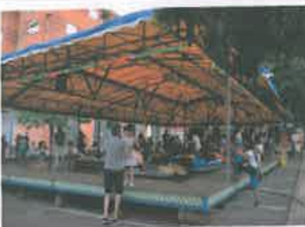
San Juan 2019