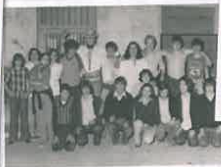
San Juan 1978