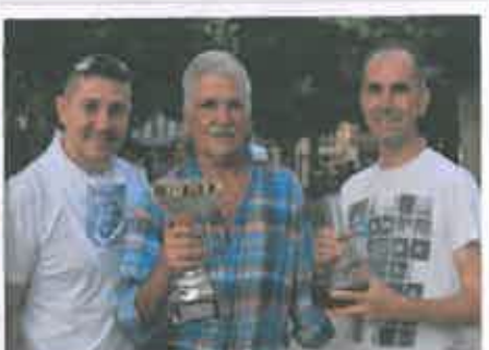
San Juan 2017