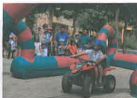
San Juan 2017