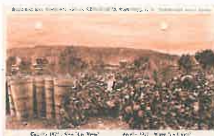
Vendimias en Bodegas del Romeral