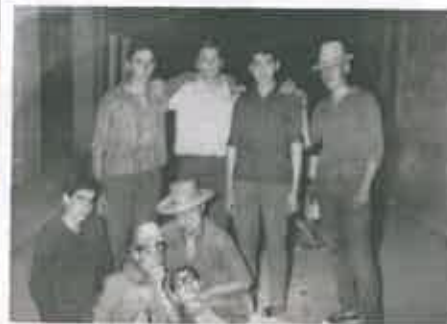
San Juan 1963