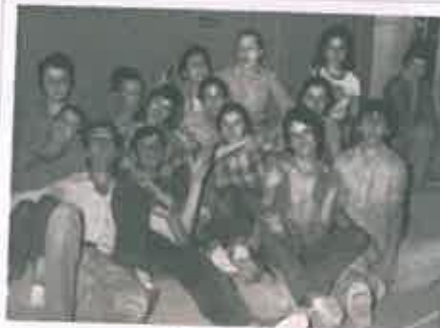
San Juan 1976