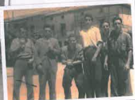
San Juan 1957