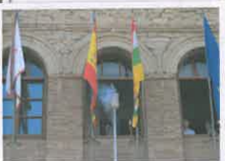
San Juan 2017