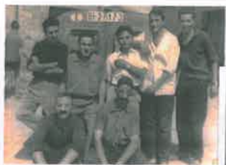
San Juan 1962