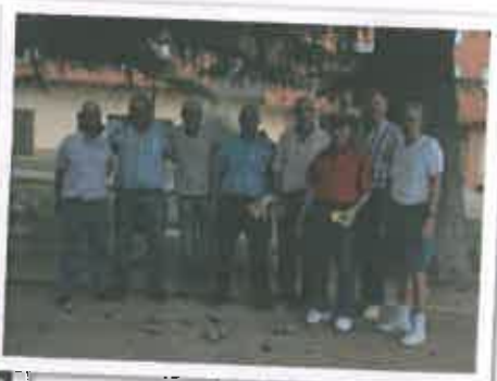
San Juan 2016