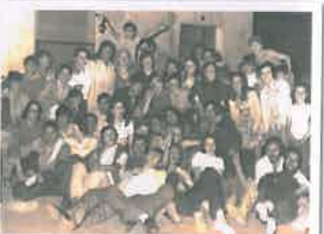
San Juan 1973