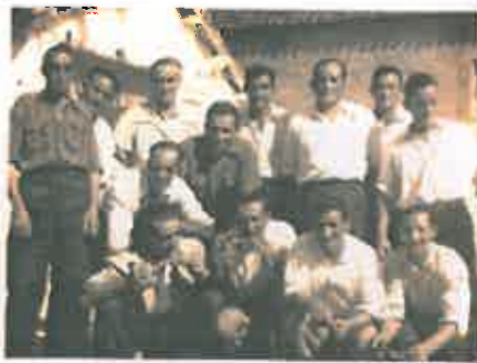
San Juan 1945