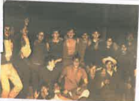
San Juan 1969