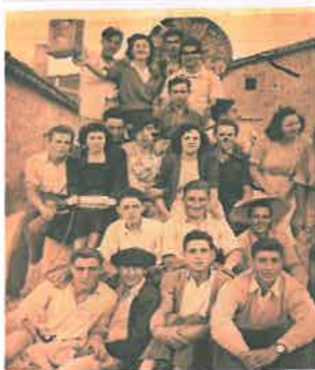
San Juan 1948