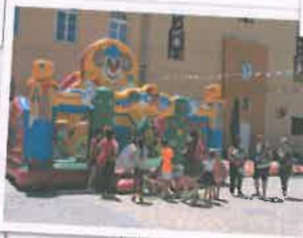
San Juan 2018