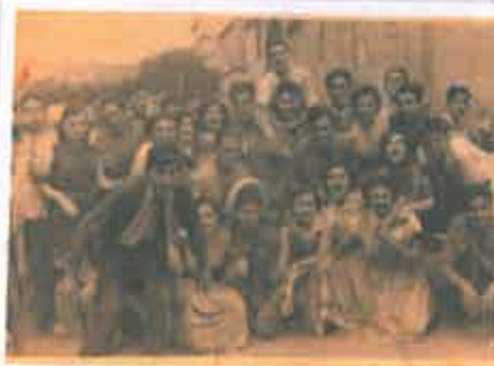
San Juan 1955