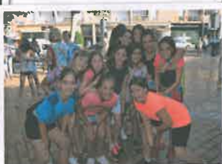
San Juan 2017