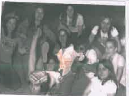
San Juan 1975