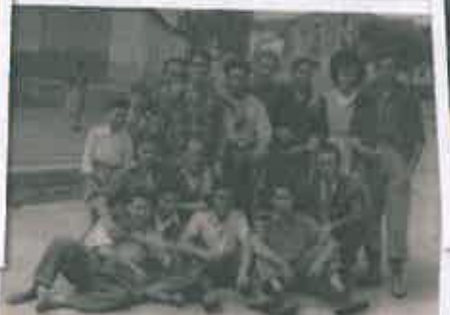
San Juan 1956