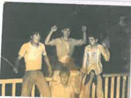
San Juan 1973