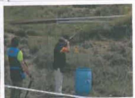
San Juan 2016