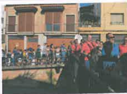
San Juan 2017