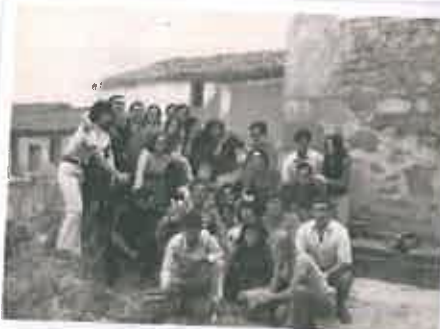
San Juan 1972