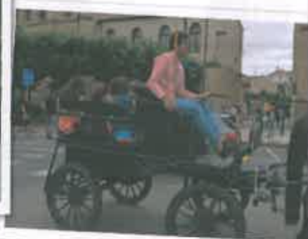
San Juan 2016