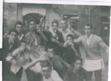
San Juan 1966