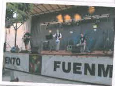
San Juan 2018