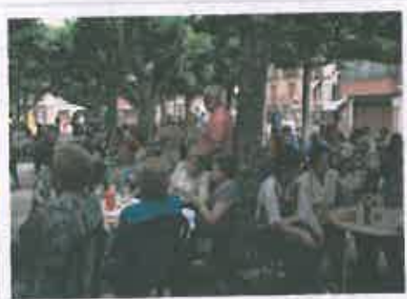
San Juan 2016