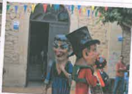
San Juan 2019