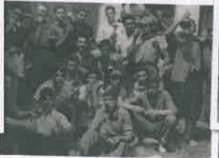
San Juan 1959