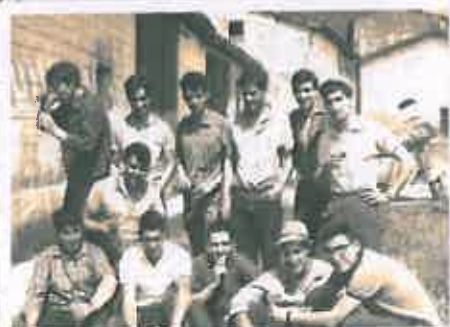
San Juan 1968