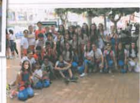
San Juan 2019