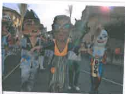
San Juan 2017