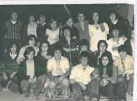
San Juan 1975