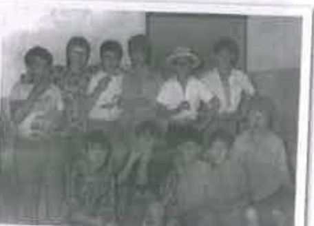
San Juan 1975