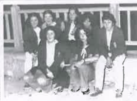
San Juan 1976