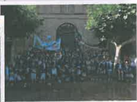
San Juan 2017