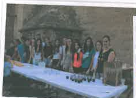
San Juan 2017