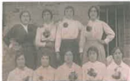
Mujeres de fiesta a principios de siglo