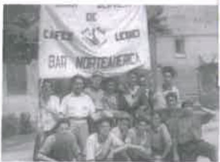
San Juan 1967