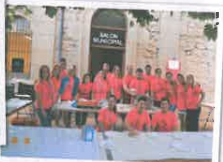
San Juan 2016