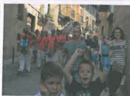
San Juan 2017