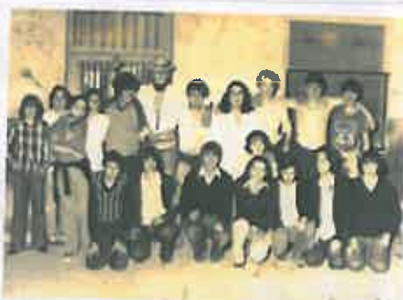
San Juan 1974