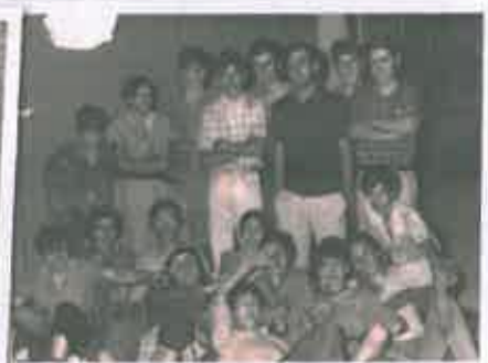
San Juan 1973