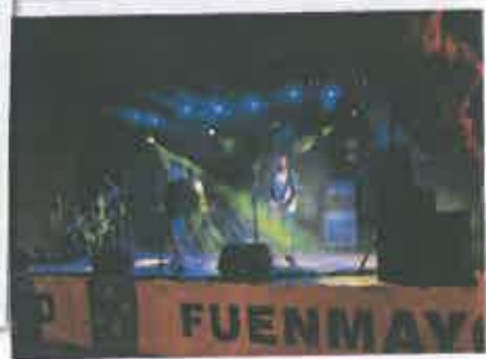
San Juan 2017