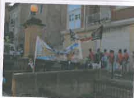
San Juan 2017