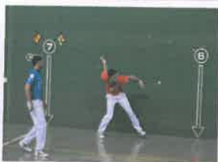
San Juan 2017