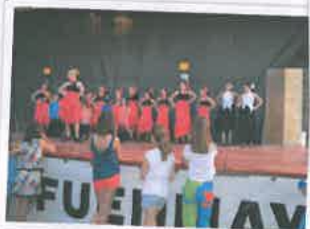
San Juan 2016