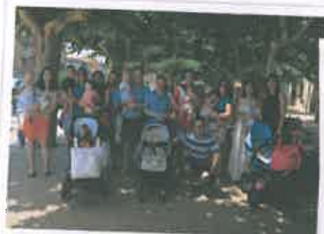
San Juan 2017