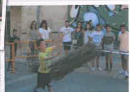
San Juan 2018