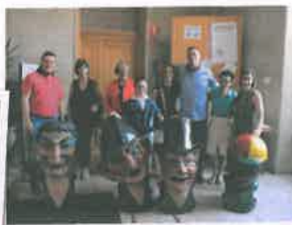
San Juan 2018