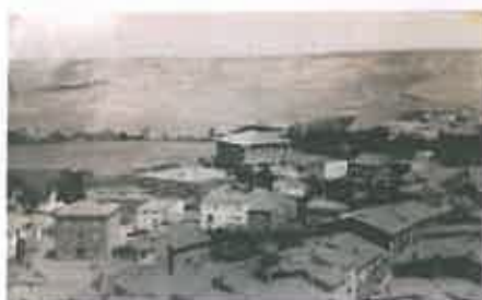
Fuenmayor hacia 1920