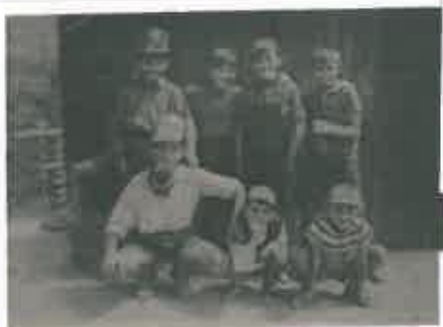
San Juan 1964