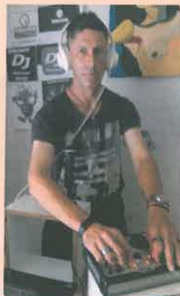
"Programa Remember Forever, con Josehouse, todos los viernes noche el mejor sonido remember desde las 23:00 h."