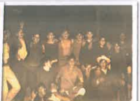
San Juan 1975