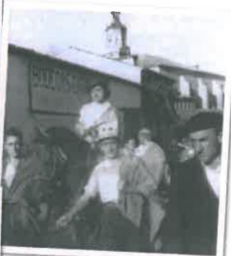
San Juan 1947