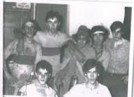
San Juan 1971