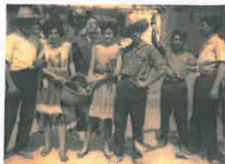
San Juan 1961