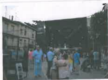
San Juan 2017