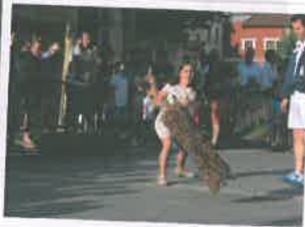
San Juan 2017