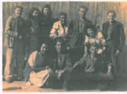
San Juan 1946