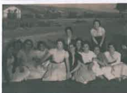
San Juan 1958