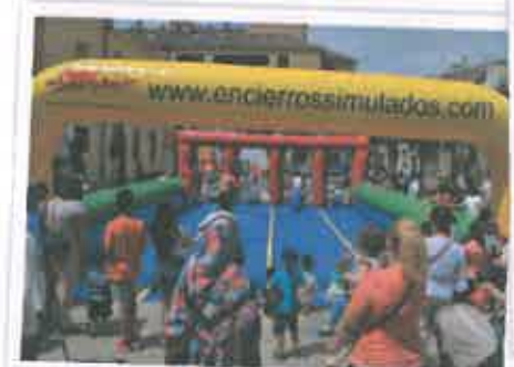
San Juan 2016