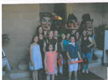
San Juan 2018