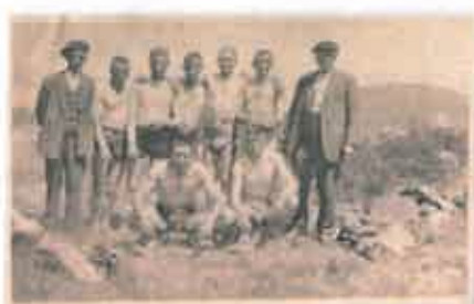
Baño en el Ebro a principios de siglo