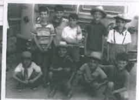
San Juan 1960