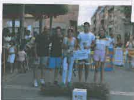
San Juan 2019