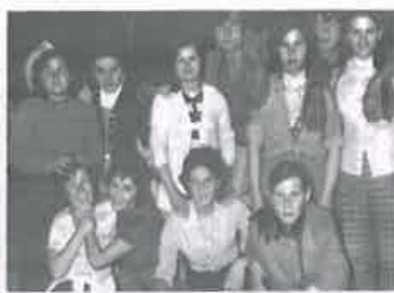
San Juan 1970