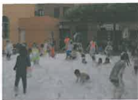
San Juan 2016