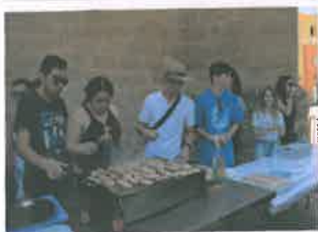
San Juan 2019