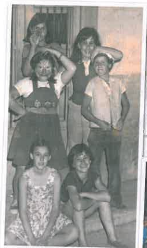
San Juan 1977