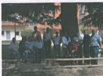
San Juan 2019