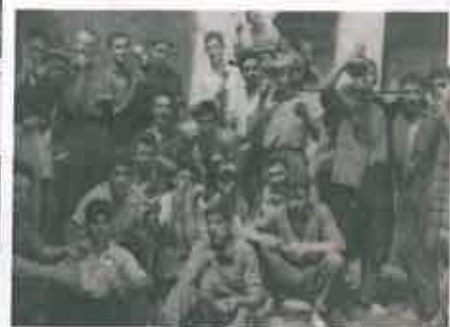
San Juan 1965