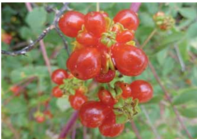
24-08-2013. Frutos maduros.