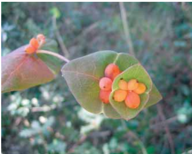
Detalle de los frutos, sobre las hojas superiores completamente soldadas.

Historia.- Lonicera , designa su género y es palabra dedicada en memoria de Adam Lonitzer, matemático, médico y botánico alemán, autor de varias obras de botánica y ciencias naturales. Etrusca : epíteto específico, que quiere decir: de Etruria , referido a la Toscana, región del norte de Italia, donde es muy característica.