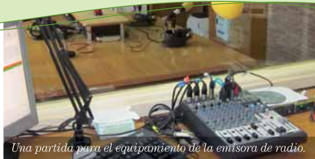
Una partida para el equipamiento de la emisora de radio.