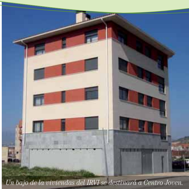
Un bajo de la viviendas del IRVI se destinará a Centro Joven.