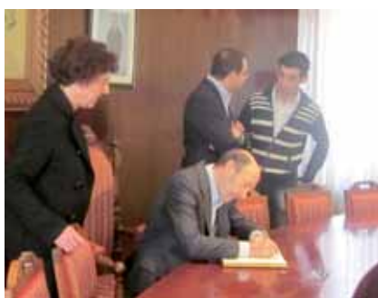
Alfredo Pérez Rubalcaba visitó Fuenmayor, siendo recibido por la

alcaldesa y los concejales de nuestro Ayuntamiento. Tras firmar en el Salón de Plenos el libro de honor, paseó por nuestro pueblo entrando incluso en una tienda del Paseo en la que se interesó tanto por los clientes como por la dueña del establecimiento. En su recorrido se acercó a la Escuela Infantil Municipal Gloria Fuertes, visitó la guardería y saludó a los fuenmayorenses que se acercaron a conocerle.