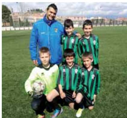
El C.D. Tedeón, con el que tenemos un acuerdo para que nuestros jóve-

nes jueguen al fútbol, tiene un convenio de filialidad de fútbol base con el Athletic Club de Bilbao.