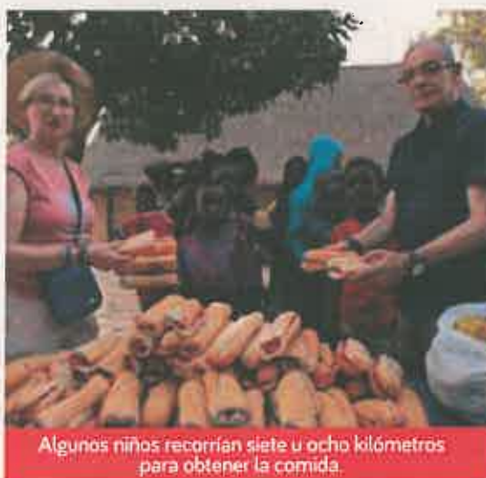
Algunos niños recorrían siete u ocho kilómetros para obtener la comida.