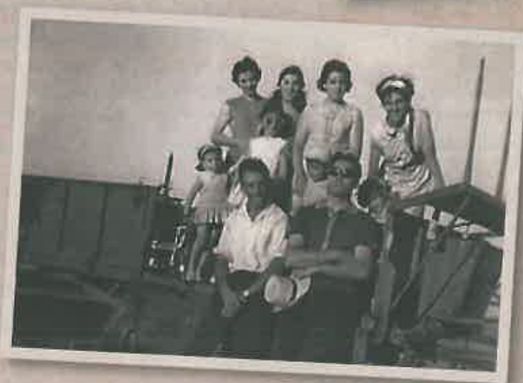
Jira de 1970.