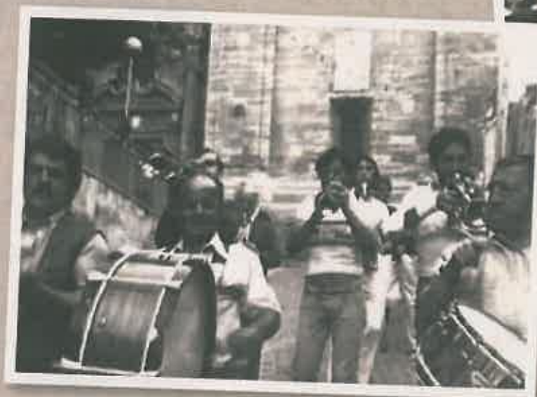
Charanga en la antigua Bajada de las vocas.