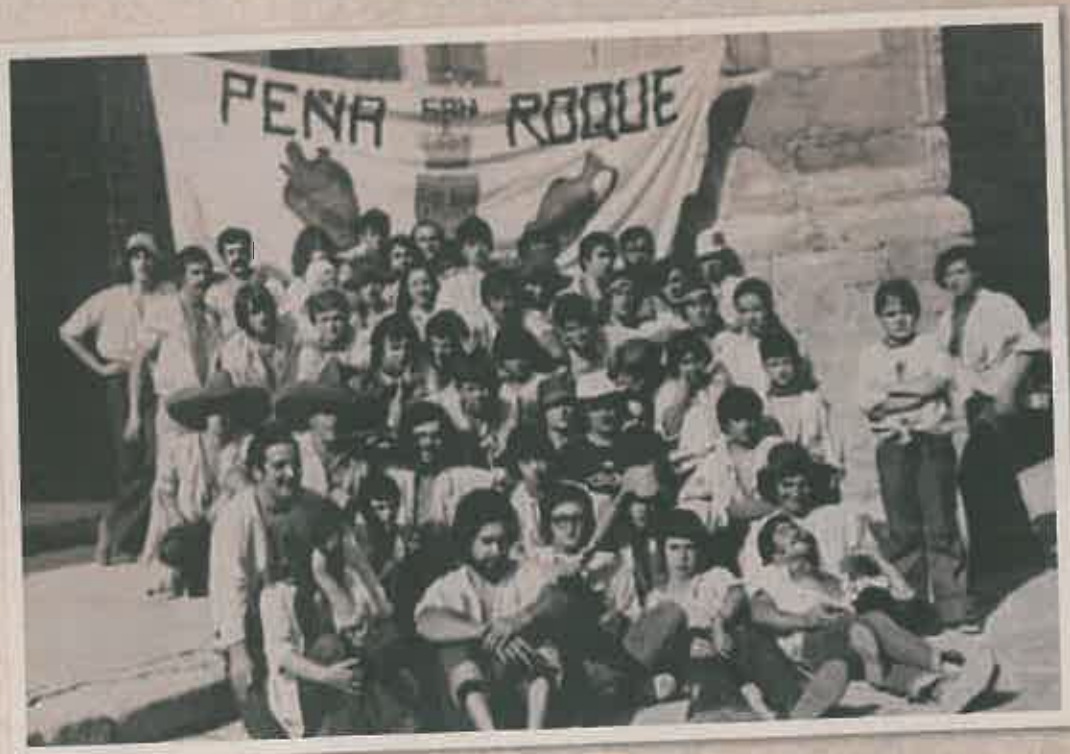
Antigua Peña San Roque.