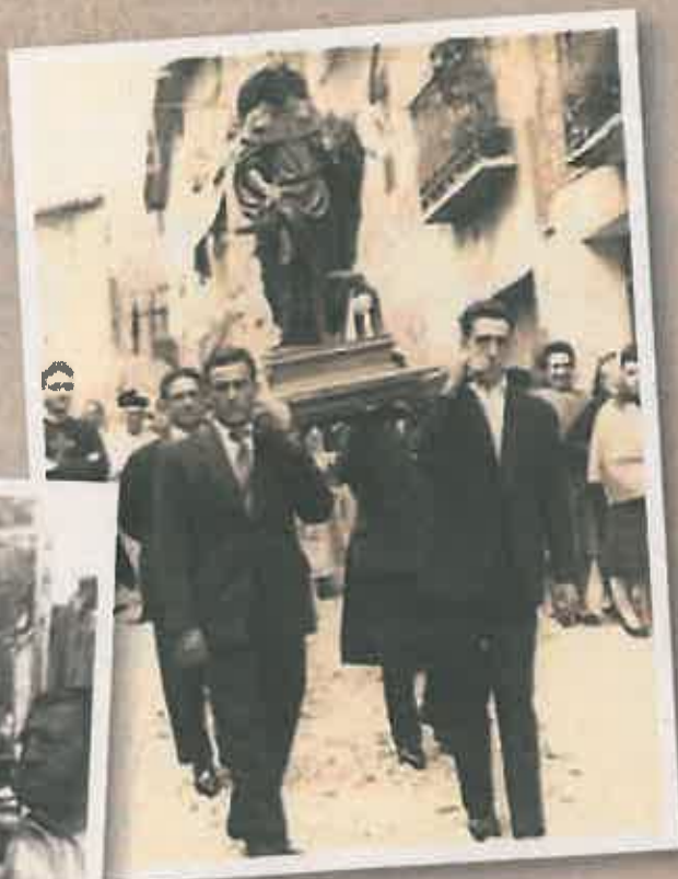
Procesión San Roque.