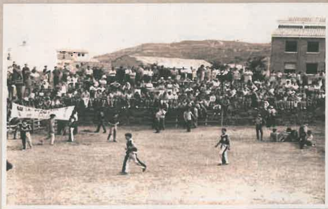
Vaquillas en la plaza.