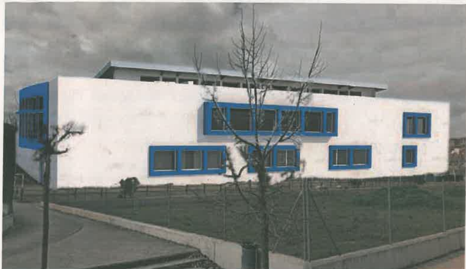
Polideportivo de Navarrete. En construcción. Simulación