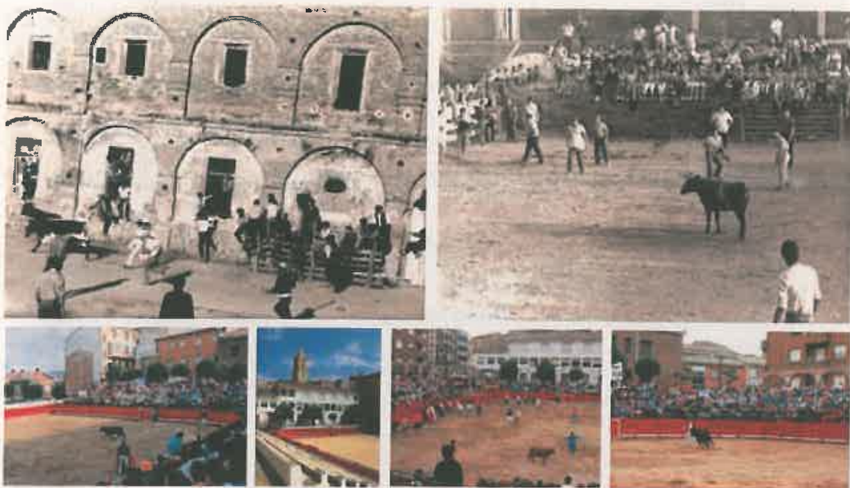
Distintos momentos de la historia de la plaza de toros en Navarrete.

celebrarlo se organizó una fiesta de vaquillas del hierro de la Bomba de Casetas en Zaragoza. Todo el mundo estaba ilusionado y disfrutando del momento.